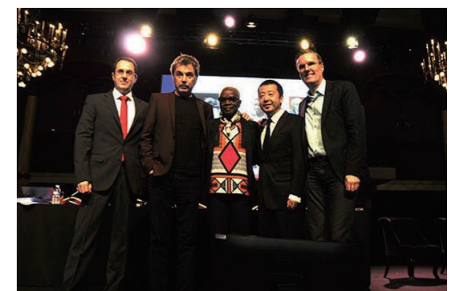
左二 CISAC主席 让-米歇尔·雅尔（Jean-Michel Jarre）

贾樟柯1970年生于中国山西省汾阳，从1995年起开始电影编导工作，由他编剧、执导的多部影片曾在国际各大电影节获奖，其中包括第63届威尼斯国际电影节最佳影片金狮奖（《三峡好人》）、第66届戛纳国际电影节最佳编剧奖（《天注定》）、2015年获戛纳电影节“导演双周”单元终身成就“金马车奖”。2015年，贾樟柯被釜山国际电影节评选为“史上十佳”亚洲导演。