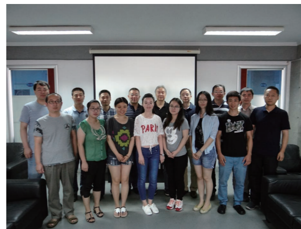
出席协会党支部成立大会的全体党员及相关领导合影