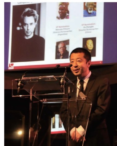
贾樟柯当选国际组织副主席 成为担任此职的首位华人

国际作者和作曲者协会联合会（CISAC）6月3日在法国巴黎举行会员大会暨成立90周年庆典，中国导演、编剧贾樟柯在会上当选联合会副主席，成为首位担任这一职务的中国创作者。该组织设立一名主席与四名副主席，现任主席为法国著名电子音乐先驱让-米歇尔·雅尔。贾樟柯在致词中说：“提升作者的著作权意识，提高公众对著作权的重视，切实维护作者的公平获酬权，会创造一个更具远见及多样性的文化环境。特别是对年轻创作者来说，长期的著作权收益，将保证他们有信心，坚